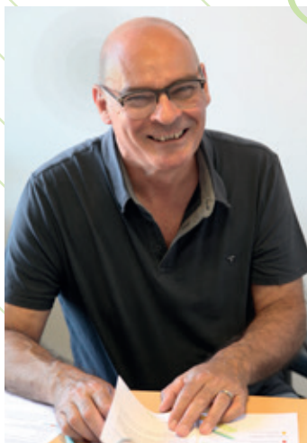
Directeur : Éric DIOCHON

Installée à la Bâtie, dans des locaux adaptés à l'enseignement artistique et aux pratiques collectives, elle est un lieu d'apprentissage musical et théâtral.